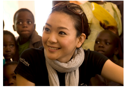
国連WFP日本大使 知花くらら 氏

1954年埼玉県生まれ。 東京大学教養学部卒業、マサチューセッツ工科大学政治学 大学院修了 (Ph.D.)。東京大学理事、副学長などを歴任し、 2012年4月、JICA理事長に就任。JICA事業の視察や各国要 人との意見交換、国際会議への出席等、これまでにアジアや アフリカの開発途上国を始め世界40か国近くを訪問。「元気の 出る国際協力」を掲げ、国内外で精力的な活動を行っている。